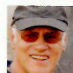
... von Cav. Horst Scholz Pinzgauer Bezirksarchiv Stadtmuseum im Vogtturm Museumsverein Zell am See

Die Pinzgauerbahn hatte den letzten 111 Jahren, man kann fast sagen einen "Stehaufmandl-Charakter" mir allen Höhen und Tiefen und die "Wiederbelebung" zeigt bereits einen erfreulichen Kurs für die nächsten Jahre und wir freuen uns schon, wenn es heißt: "Endstation Krimml, alles aussteigen"!